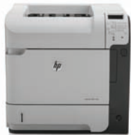
HP LaserJet Enterprise 600 M603dn