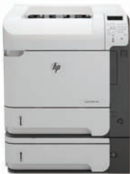
HP LaserJet Enterprise 600 M603xh