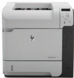
HP LaserJet Enterprise 600 M601dn