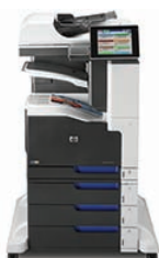
HP LaserJet Enterprise 700 color MFP M775z