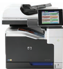
HP LaserJet Enterprise 700 color MFP M775dn