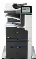
HP LaserJet Enterprise 700 color MFP M775z+