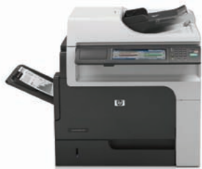
Echipament MFP HP LaserJet Enterprise M4555h