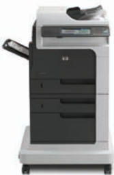
Echipament MFP HP LaserJet Enterprise M4555f