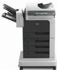
Echipament MFP HP LaserJet Enterprise M4555fsk