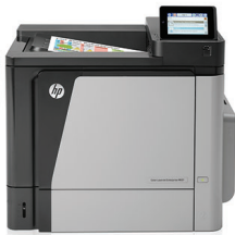
Imprimantă HP Color LaserJet Enterprise M651dn

Performanțe pe care puteți conta: imprimări de mare volum, extrem de fiabile, față-verso, pentru documente color de calitate profesională. Imprimarea eficientă printr-o atingere și opțiunile de imprimare mobilă, plus gestionarea simplă vă ajută să fiți productiv oriunde lucrați.