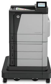
Imprimantă HP Color LaserJet Enterprise M651xh